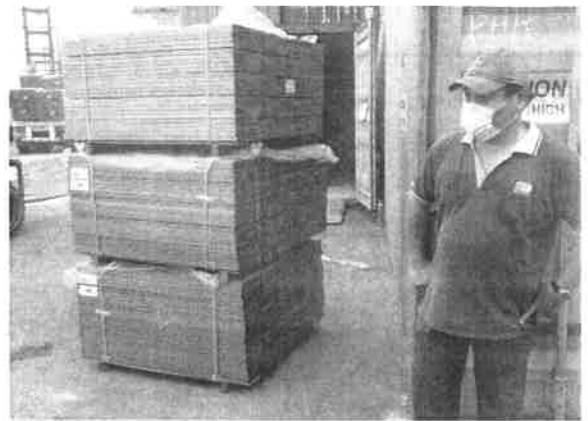
写真 2 審査機関 A による輸出港でのチェック

60～73%とされている。端材の中には日本のユーザー向けの規格に合わないだけで、建材として十分利用可能なサイズのものも多く、この端材の用途を開発しウリン材の歩留りを上げることによってウリン材の資源寿命を延ばすことは、資源の持続的利用に貢献するといえる。