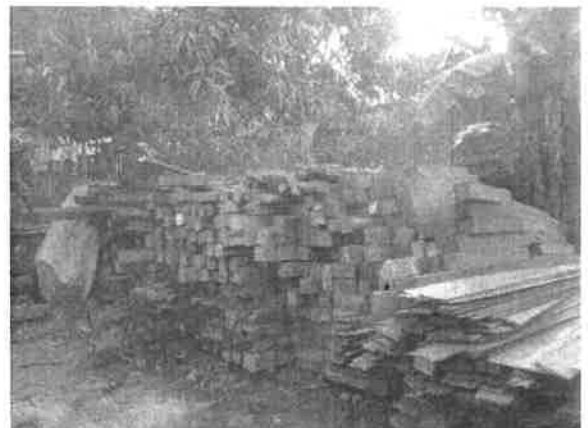
写真 3 加工施設で発生する大量の端材