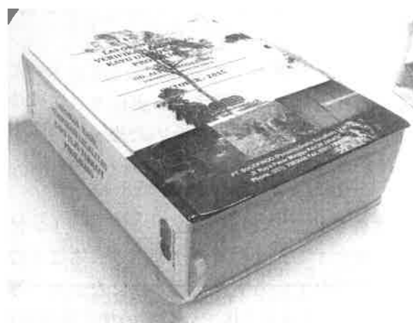
写真 1 事業者 C に審査機関 A が発行したプロカリノ

しかし、2017 年の事業者 C、F および審査機関 A に対するヒアリングにより、2017 年 1 月よ